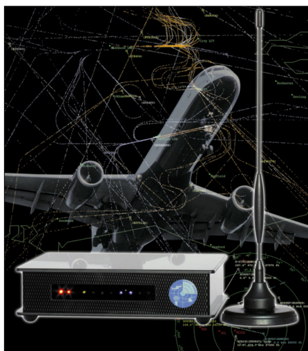
Titelbild des FA 2/06 mit dem Beitrag [4]

Der Annahme der Behörde, die Benutzung des SBS-1 verstoße gegen §§ 89, 148 TKG und sei strafbar, kann nicht gefolgt werden. Es sei bereits zweifelhaft, ob die von dem Gerät empfangbaren Signale des Navigationsfunks Nachrichten sind, die dem Anwendungsbereich der Norm unterfallen. Das Gericht erklärte der Bundesnetzagentur sodann einige technische Zusammenhänge. Es führte aus, dass die empfangenen Signale des Flugnavigationfunks durch die Software auf dem PC-Bildschirm optisch wie Flugbewegungen auf einen Radarschirm in Echtzeit ausgegeben, also sichtbar gemacht werden. Eine akustische Wahrnehmung des Navigationsfunks oder des Funkverkehrs der Flugzeuge ist mit dem