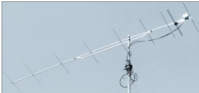
Fertig aufgebaute Antenne im Test; der vom Autor hinzugefügte Vorverstärker befindet sich in Dipolnähe an einem Ort, wo nach DK7ZB der Einfluß auf das Strahlungsdiagramm vernachlässigbar ist.

rend geringen Windlast über Wochen hinweg kaum durch. Der Zusammenbau geht in etwa einer Stunde vonstatten, vorausgesetzt, man legt sich vorher alle Schlüssel bereit. Aufbauschema und Stückliste sind günstigerweise so auf die zwei beiliegenden Blätter verteilt, daß ein Umblättern entfällt. Unschwer ist zu erkennen, wie der Dipol zu montieren und in welcher Richtung die