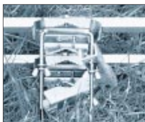
Die zwei kräftigen Mastschellen verleihen dem Tragwerk die notwendige Stabilität.

Eine um 180° versetzte Anbringung des Strahlers ist möglich – wichtig für die Phasendrehung bei vertikaler Stockung in Back-to-Back-Montage. Die Mastschellen halten nicht zugleich den Boom zusammen, was ein Ausbalancieren unter individuellen Bedingungen der Kabelführung